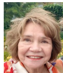
Marianne Vos- Robinson